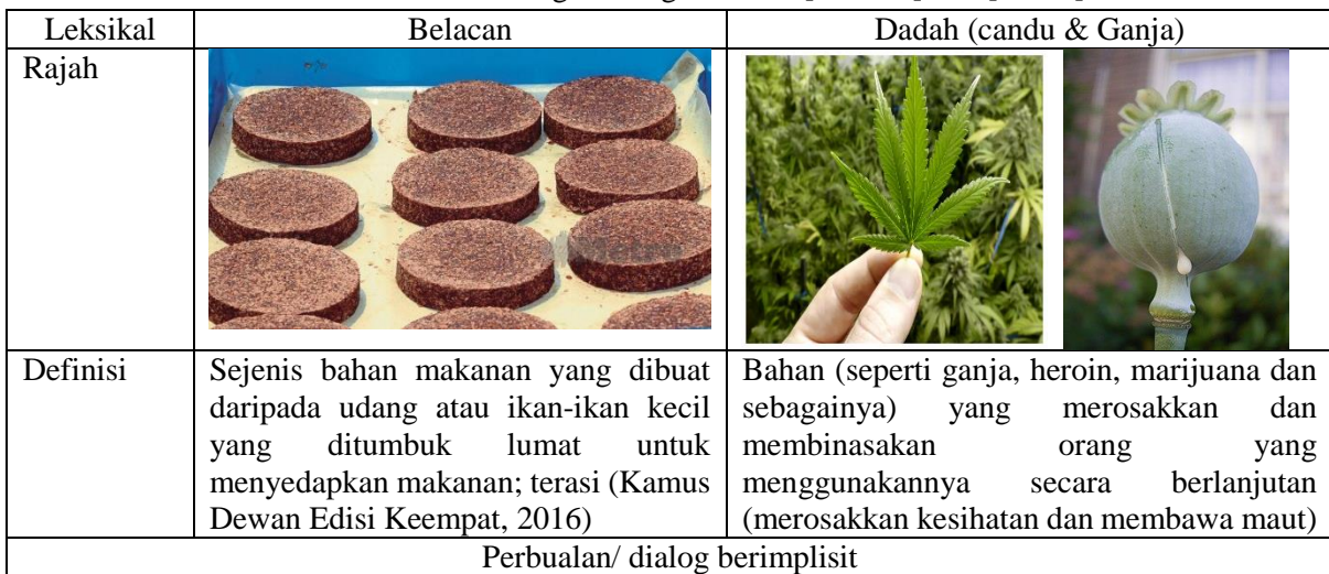
Jadual 3: Gambaran kognitif bagi leksikal [belacan] dan [dadah]

Teori yang ampuh telah diaplikasi pada tahap ini iaitu teori relevans daripada Sperber dan Wilson (1986, 1995). TR mengetengahkan tiga konsep penting bagi memperlihatkan kerelevanan sesuatu ujaran berdasarkan konteks, kesan kognitif dan usaha memproses. Di samping itu, teori relevans membenarkan pencarian makna berdasarkan andaian-andaian yang kukuh, maka, pelbagai andaian boleh wujud pada peringkat ini di samping data tersebut juga diinterpretasi dengan menggunakan Rangka Rujuk Silang seperti di bawah;