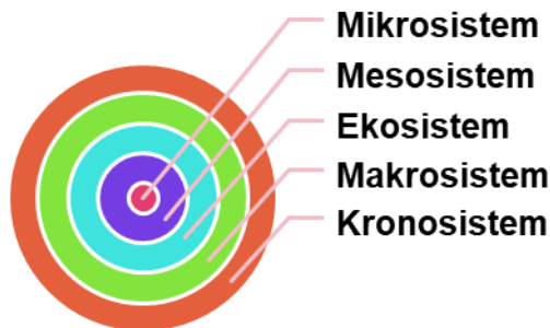
Rajah 2: Teori Ekologi Bronfenbrenner

atau peranan teori ekologi persekitaran supaya mendapat garis panduan yang khusus untuk membina satu iklim budaya yang positif dalam kalangan warga sekolah, komuniti, masyarakat dan ummah dengan menggunakan pengintegrasian teori dengan lebih terperinci.