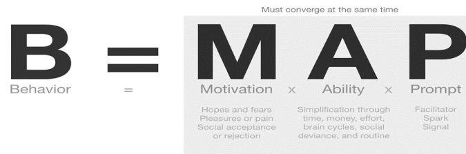
Rajah 2: Rangka Fogg Behavior Model (FBM)

Hasil carian di dalam kajian-kajian yang mengkaji kefahaman, pengetahuan mahupun kesedaran wanita dalam menuntut hak-hak selepas perceraian, tiada kajian mendalam yang membentangkan hasil kajian faktor atau punca yang mendorong seseorang wanita untuk mengambil tindakan untuk menuntut hak-hak yang sedia tercatat dalam undang-undang.