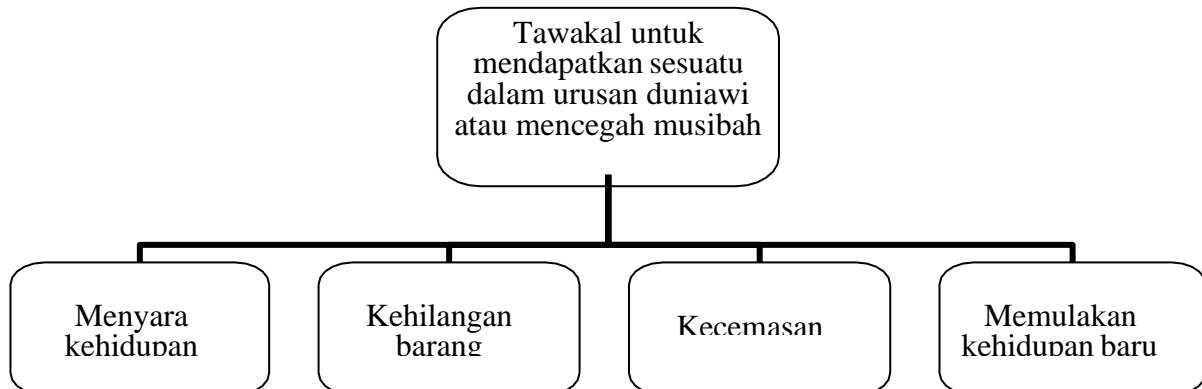
Rajah 2: Aspek-aspek Tawakal dalam Travelog Biniku Ninja

Melalui proses pembacaan secara mendalam dan teliti pada travelog Biniku Ninja , pengkaji telah mendapati bahawa analisis kajian lebih sesuai dijalankan pada jenis tawakal untuk mendapatkan sesuatu dalam urusan duniawi atau mencegah musibah. Rajah berikut merupakan antara aspek-aspek tawakal dalam travelog Biniku Ninja yang bersesuaian dengan jenis tawakal tersebut: